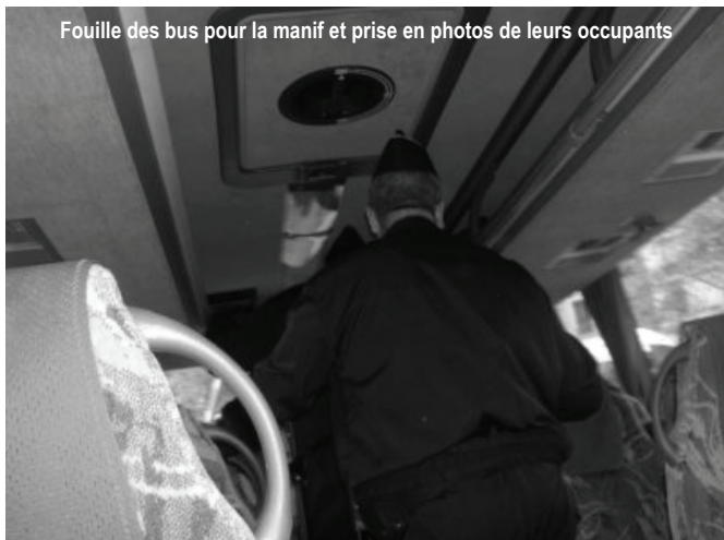
Fouille des bus pour la manif et prise en photos de leurs occupants

Ce qui s'est passé ce lundi marquera les esprits par son caractère autoritaire. Comment ne pas être révolté par la non reconnaissance des contestations, par la censure de la