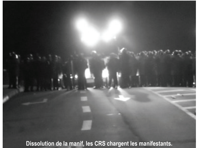
Dissolution de la manif, les CRS chargent les manifestants.

presse, par l'artillerie lourde de l'État français, par les politiques fascistes de toute l'Europe. Quelle est la limite entre un État oppresseur et un État dictatorial qui nous tue !! Vichy a été le théâtre d'actes liberticides de la part de l'État et nous en avons été les victimes de près ou de loin.